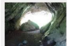
Das Quackenschloss ist eine Höhlenruine